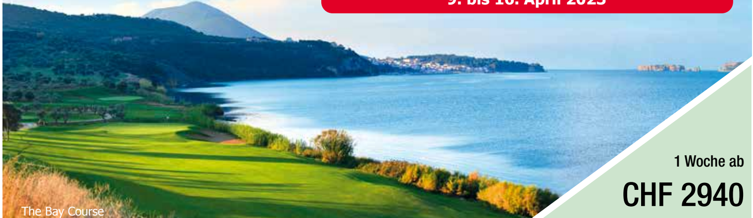
The Bay Course